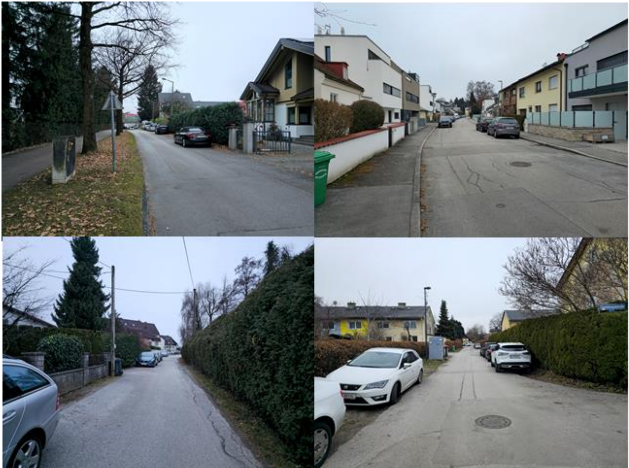
Abbildung 1: Beispiele für die Parkraumauslastung im betroffenen Gebiet (Peter-Pfenninger-Straße, Tiefenbachhofstraße, Grafenweg, Gstöttengutstraße)

Hinsichtlich der beobachteten Kennzeichen handelt es sich bei rund der Hälfte um Stadt Salzburger Kennzeichen, die andere Hälfte verteilt sich auf verschiedenste österreichische sowie europäische Kennzeichen. Anhand der Kennzeichen kann jedoch zum jetzigen Zeitpunkt nicht festgestellt werden, ob es sich um das Fahrzeug eines Bewohners oder um einen gebietsfremden Parkenden handelt.